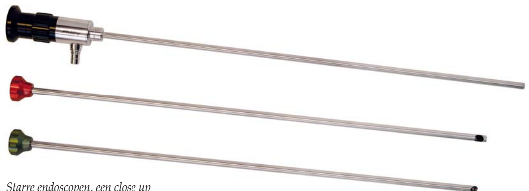
Starre endoscopen, een close up

het probleem zich waarschijnlijk bevindt in het motorblok. Door het verstuivergat van de motor wordt met de endoscoop daarom eerst de binnenzijde van de cilinders geïnspecteerd, om te zien of het hoonpatroon onderhevig is aan slijtage. Stefan van der Beek, sales & marketing directeur van Systematic, leverancier van onder andere maatwerk-endoscopie-sets, legt ►